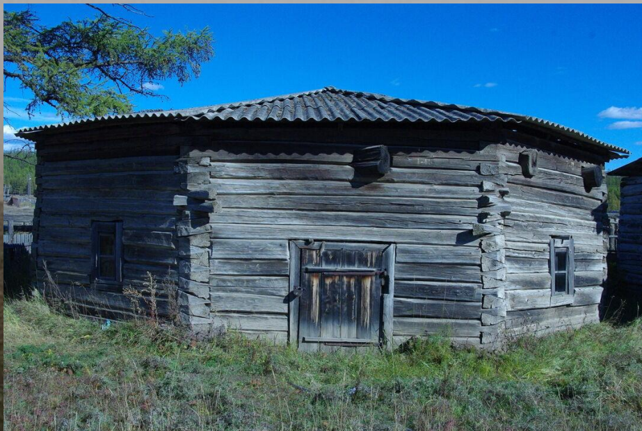
Современная якутская деревянная юрта

Традиционно якуты вели полуоседлый образ жизни и имели летнее и зимнее жилища. Летние юрты обычно располагались возле водоемов и были достаточно легкими, зимние же обладали утепленной конструкцией. Со второй половины XVIII распространились русские избы, а также смешанные типы жилищ.