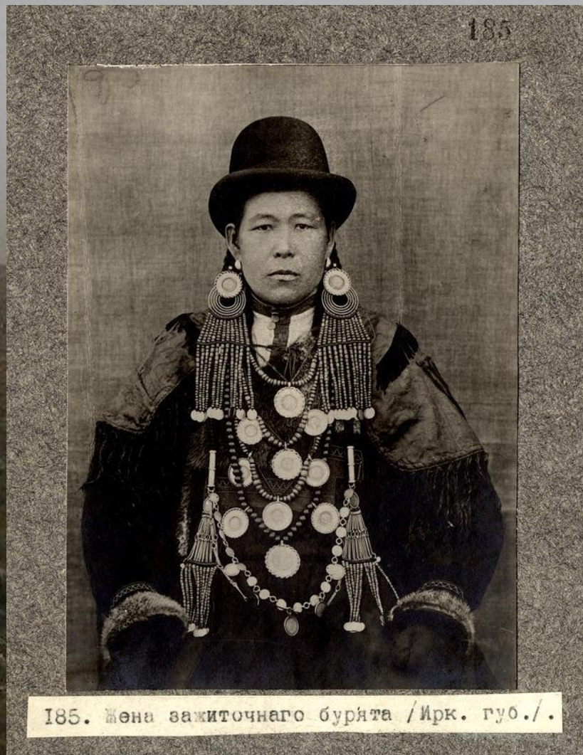
185. Жена зажиточного бурята /Ирк. губ./.