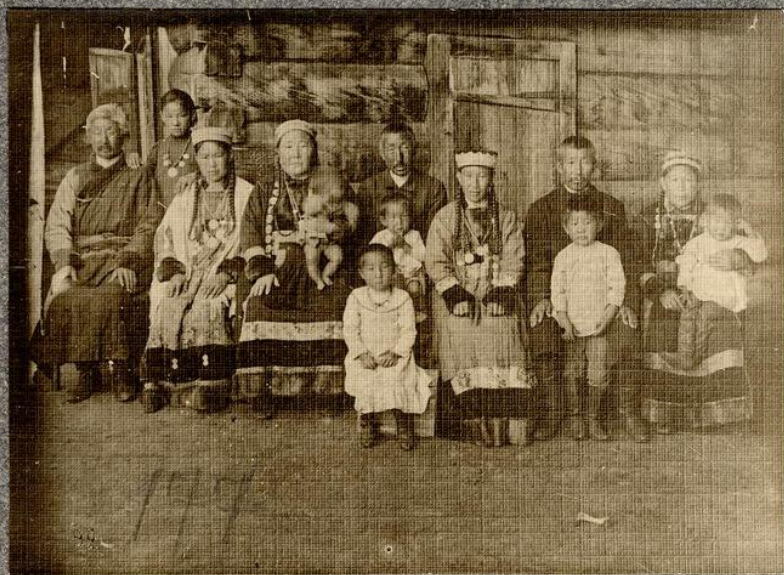
177. Группа бурятов Бархотенского улуса, Иркутск. г. Направо - буряты в национальном костюме, в них же и женщины.

Социальная структура бурятского общества сохраняет черты территориально-родового строя, в чистом виде сохранявшегося в рамках этноса до XIX века.