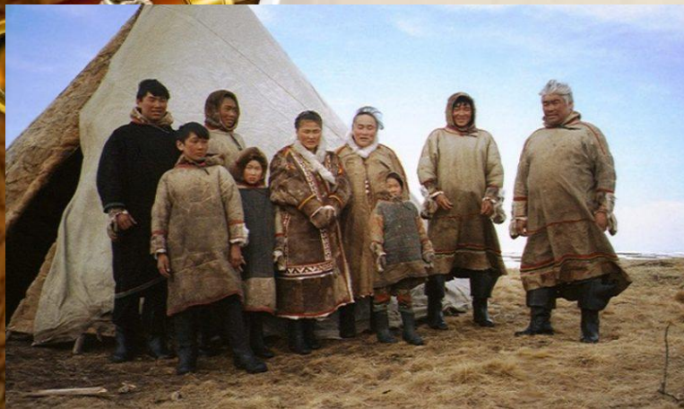
Долганы — коренной народ севера Красноярского края