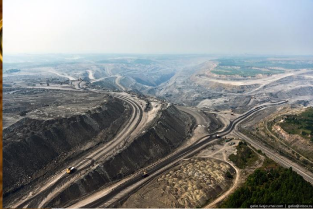
Кузнецкий угольный бассейн

❖ В Кузнецком и Горловском бассейнах ведётся разработка энергетических и коксующихся углей. По масштабам добычи Кузнецкий бассейн — ведущий в стране. Отсюда уголь поставляется в европейскую часть России, идёт на экспорт.