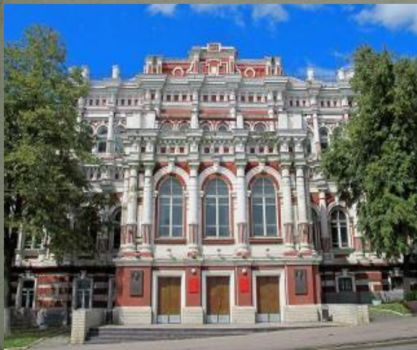
Театр братьев Барсовых, 1792 г.