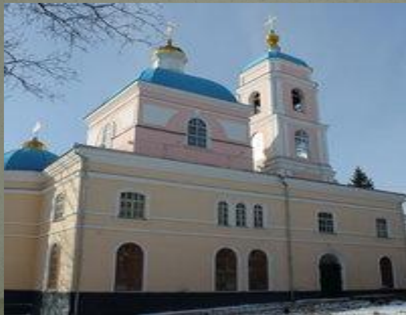
Церковь Иоанна Богослова, 1780 г. (ул. Дзержинского)