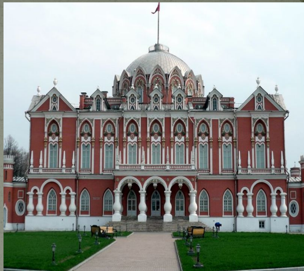
Петровский путевой дворец