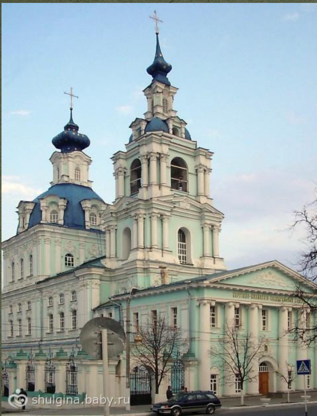
Сергиево- Казанский собор, 1778 Г.