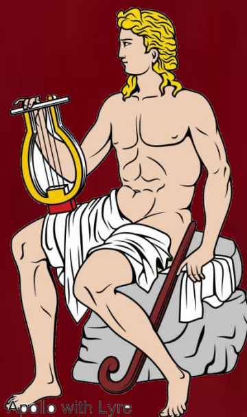
Apollo with Lyre