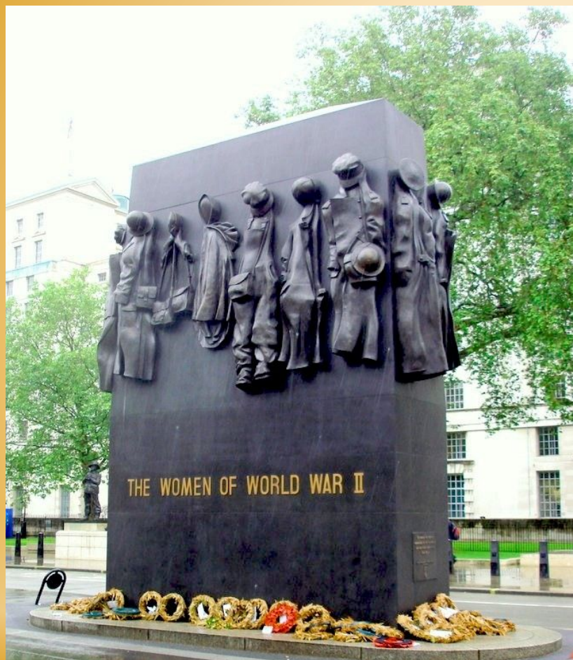
Памятник женщинам во Второй мировой войне

Лондон, Великобритания. Этот монумент установлен на Уайтхолле, возле здания Минобороны Соединенного Королевства. Он посвящен труду миллионов женщин, которые в войну вынуждены были заниматься тяжелым мужским трудом, чтобы помочь стране выстоять. По сторонам монумента развешаны семнадцать бронзовых комплектов одежды - рабочие спецовки, военная форма, полицейская форма, одежда медсестер, противогазные сумки и даже газосварочный шлем.