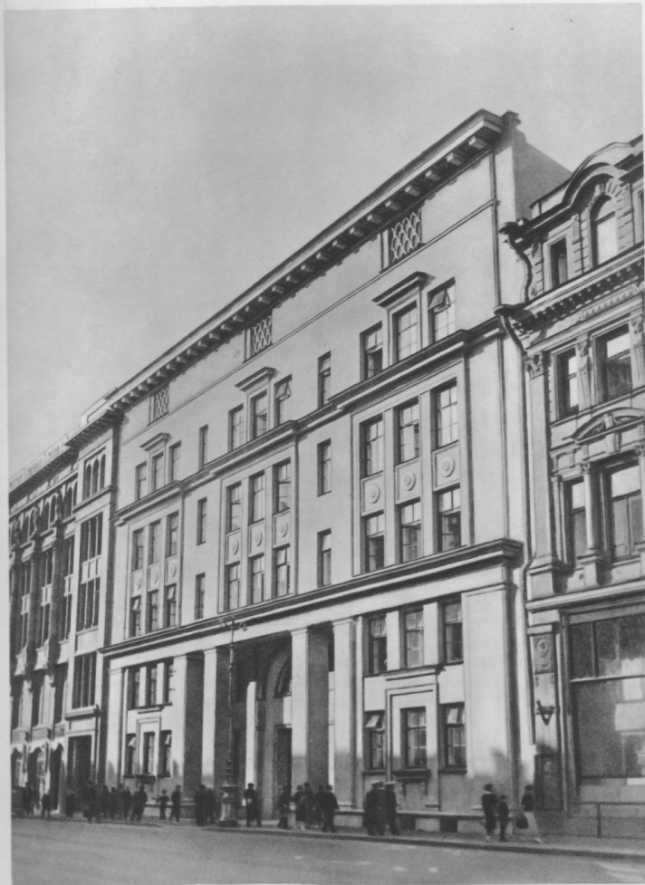
211. Здание школы на Невском проспекте Б. Р. РУБАНЕНКО. 1939