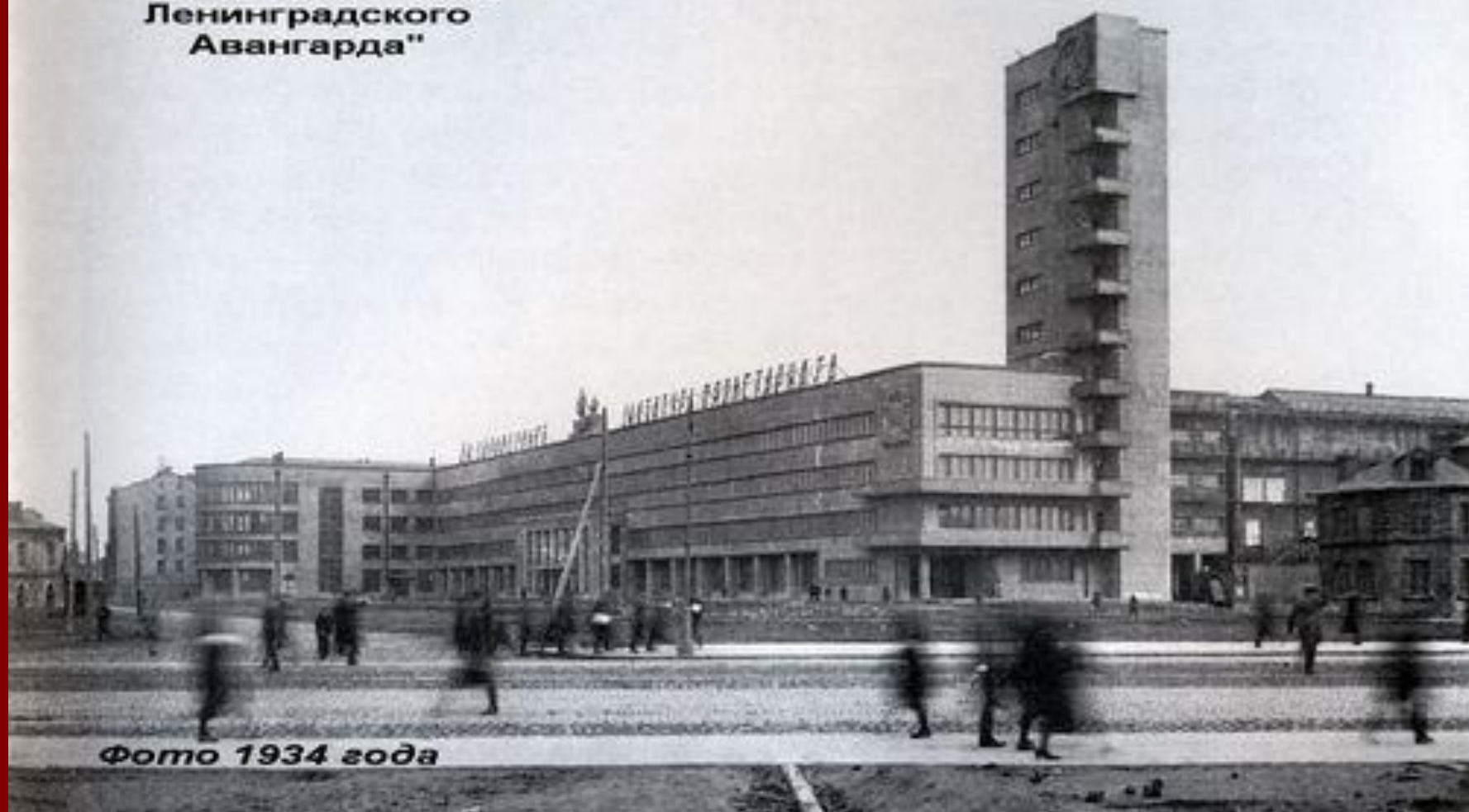
Фото 1934 года