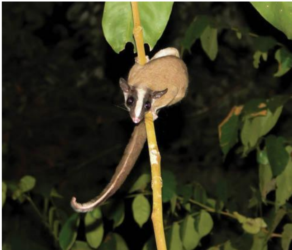
Рис. 11-13 Внешний вид и ареал обитания пушистохвостого опоссума ( Glironia venusta )