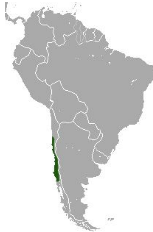
Рис.23-25 Внешний вид и ареал обитания изящного мышиногo опоссума ( Thylamys elegans )