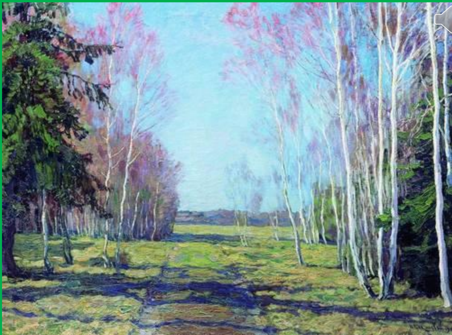
В.Н. Бакшеев В начале весны.