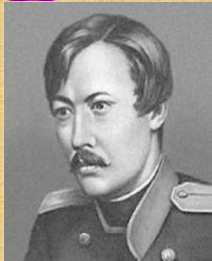
Шоқан Уалиханов (1835-1865 ж.ж.)