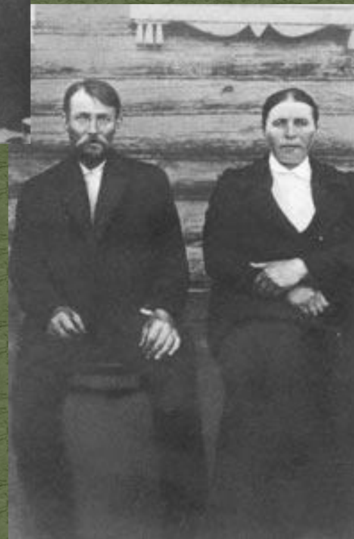
Родители С.Есенина. 1924 г.

«С двух лет был отдан на воспитание довольно зажиточному деду по матери, у которого было трое взрослых неженатых сыновей, с которыми протекло почти все мое детство...»