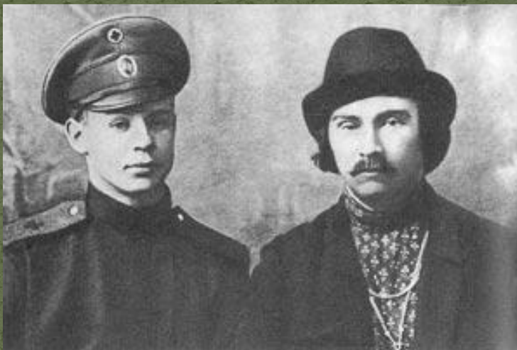
С. Есенин и Николай Клюев. Фотография 1916 г.