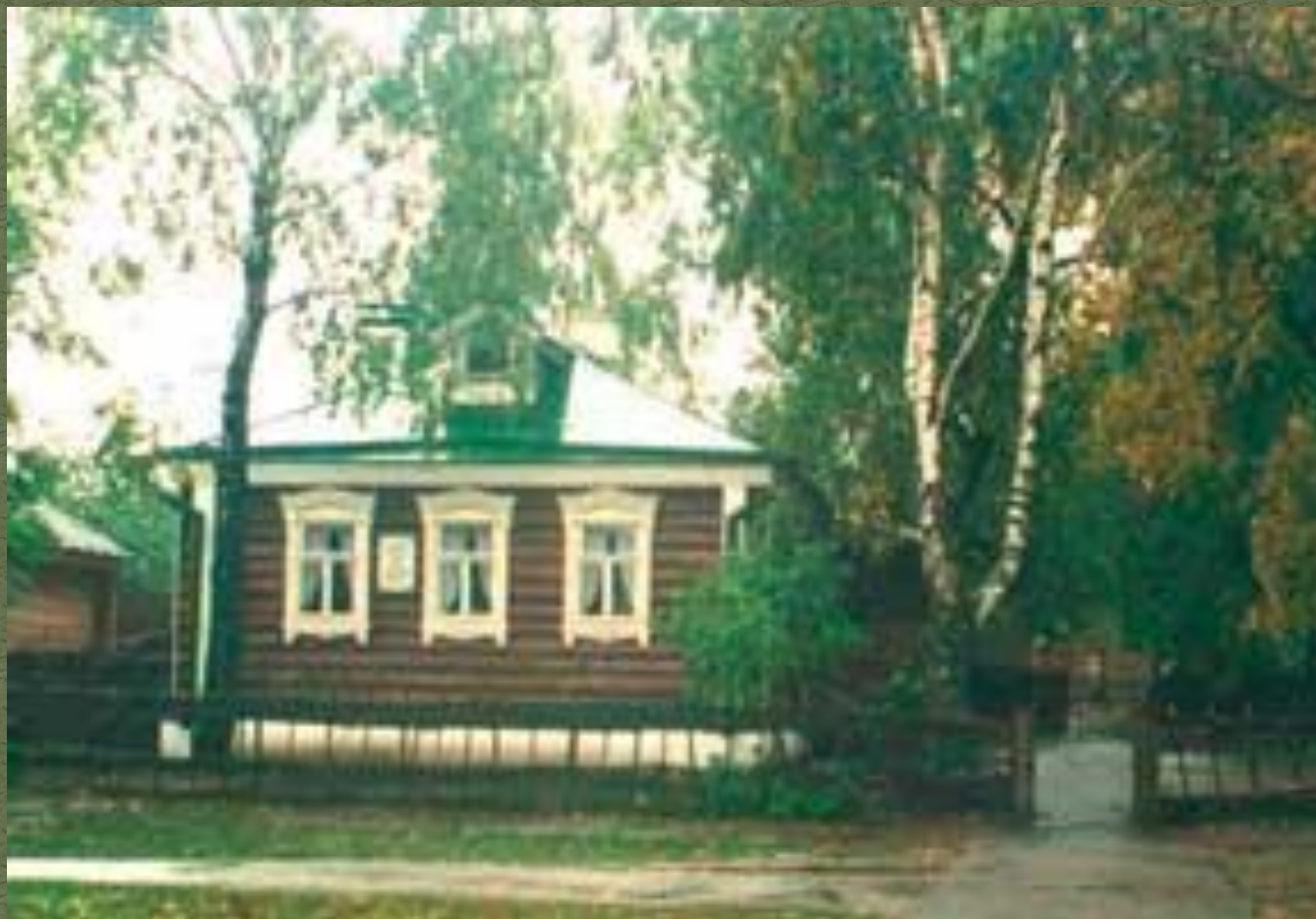
Дом-музей С. Есенина в с. Константиново.