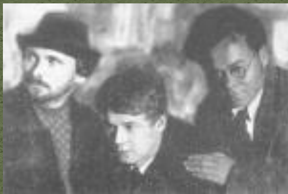
Н.А. Клюев, С.А. Есенин, Всеволод Иванов. 1924 год.