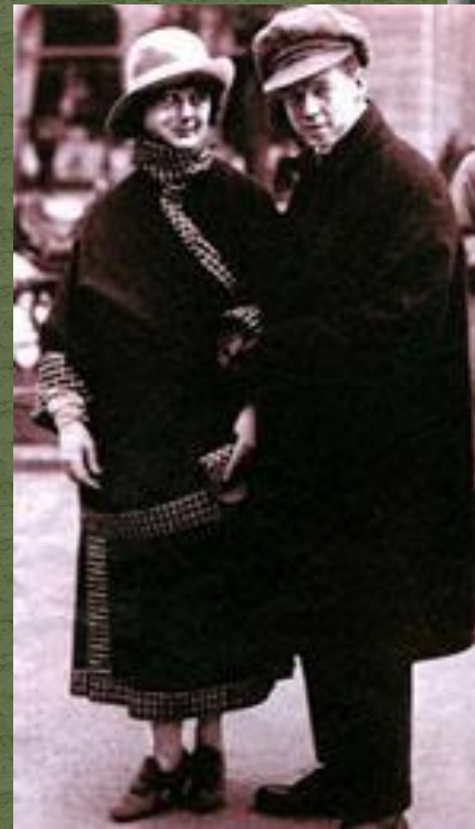
С.Есенин и А. Дункан. Берлин. 1922г.