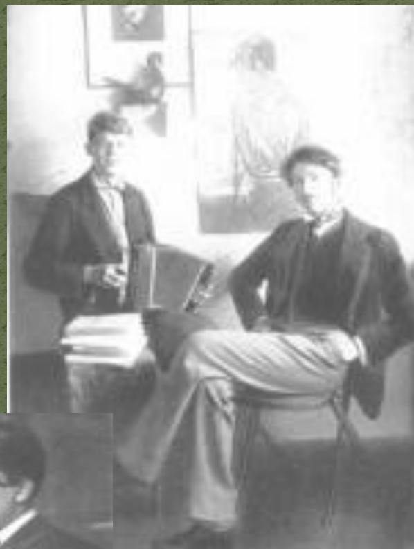
С.А. Есенин и С.М. Городецкий. 1915 год.