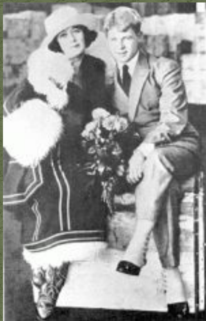
С.Есенин и А. Дункан в Америке 1922 г

Я покинул родимый дом, Голубую оставил Русь... С.Есенин