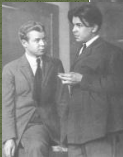
С.А. Есенин и Л.М. Леонов. 1924 год.