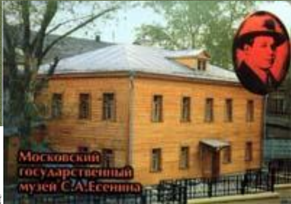
Московский государственный музей С.Есенина