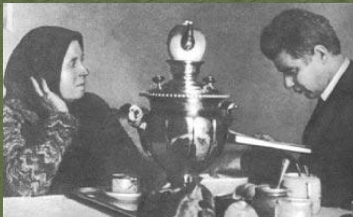
Есенин с матерью

«С двух лет был отдан на воспитание довольно зажиточному деду по матери, у которого было трое взрослых неженатых сыновей, с которыми протекло почти все мое детство...»