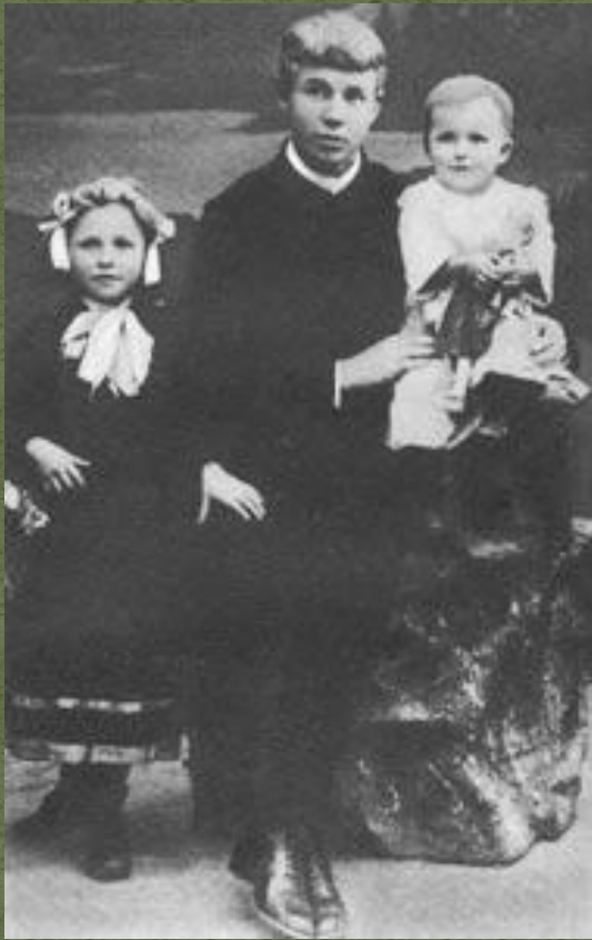
С.Есенин с сестрами Катей и Шурой. 1912г.