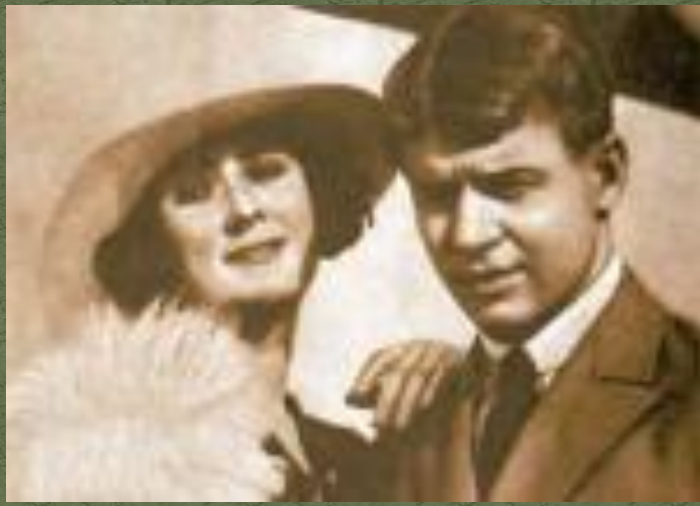
С.Есенин и А. Дункан