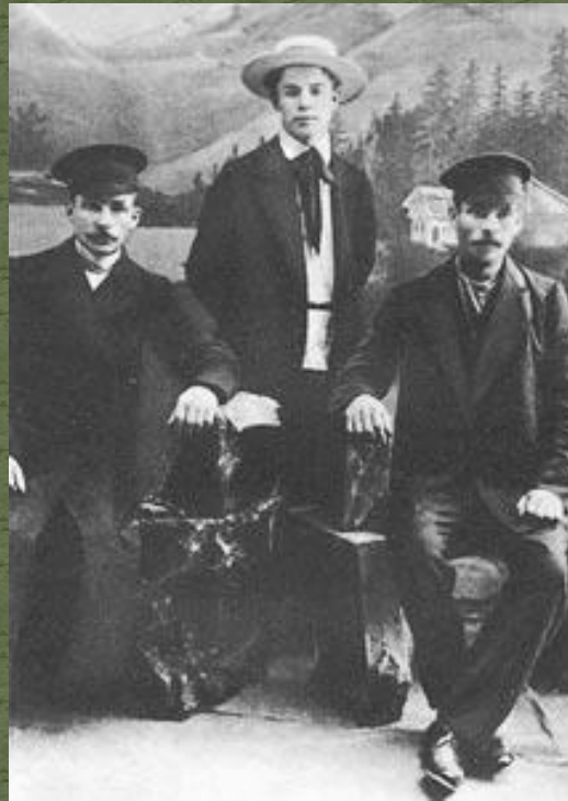
Есенин с отцом и дядей. 1913 г.