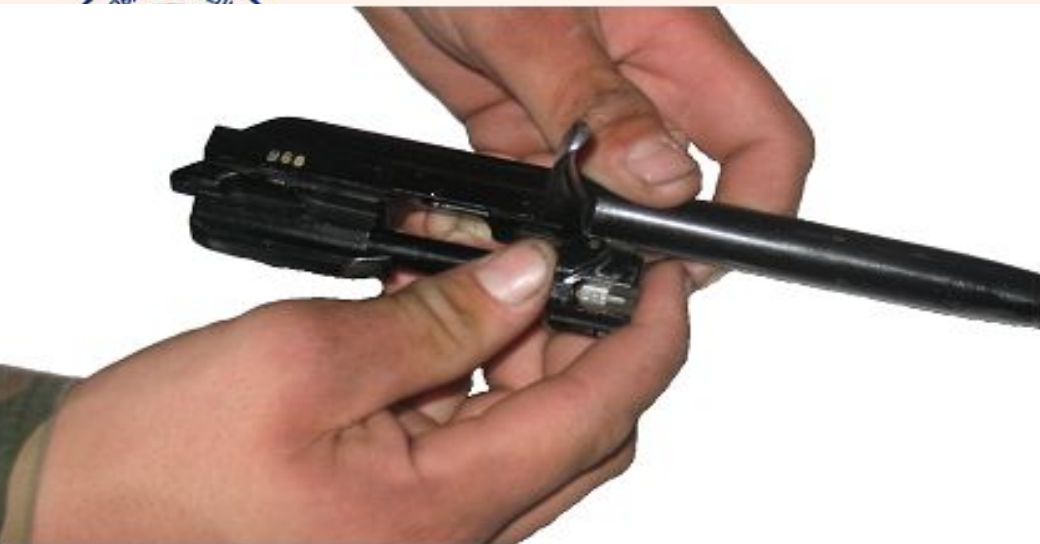
Рис. 9 Отсоединить затвор от затворной рамы