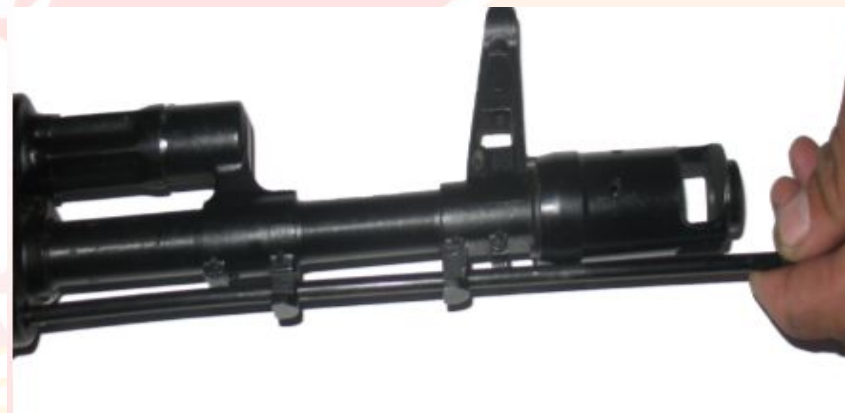
Рис. 4 Отделить шомпол