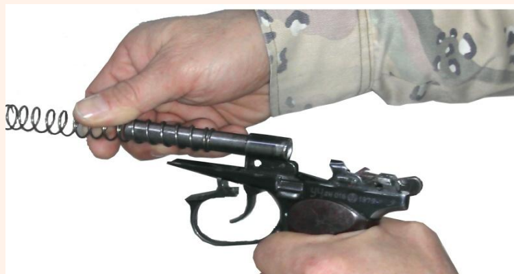
Рис. 4. Снять со ствола возвратную пружину

Сборку пистолета после неполной разборки производить в обратном порядке.