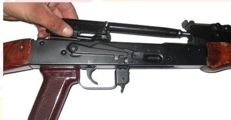
Рис. 8 Отсоединить затворную раму с газовым поршнем и затвором