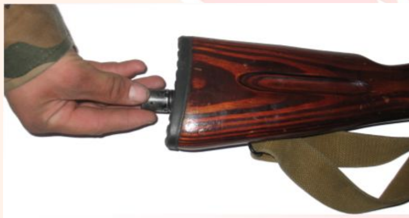
Рис. 3 Извлечь пенал