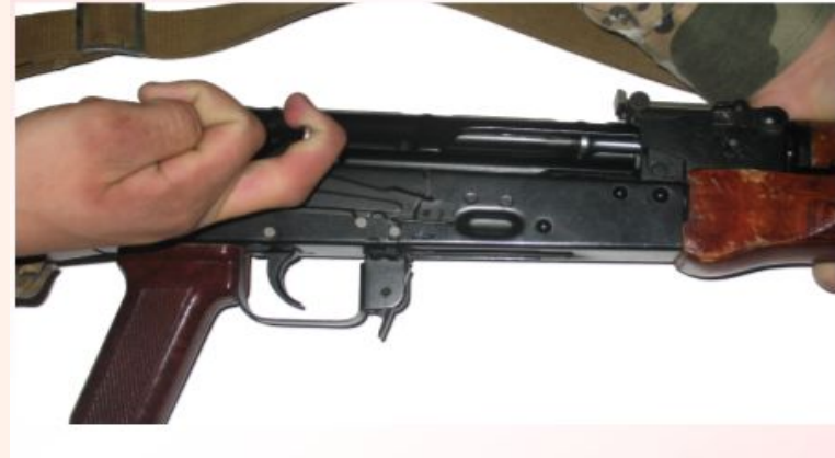
Рис.2 Проверить оружие на разряженность