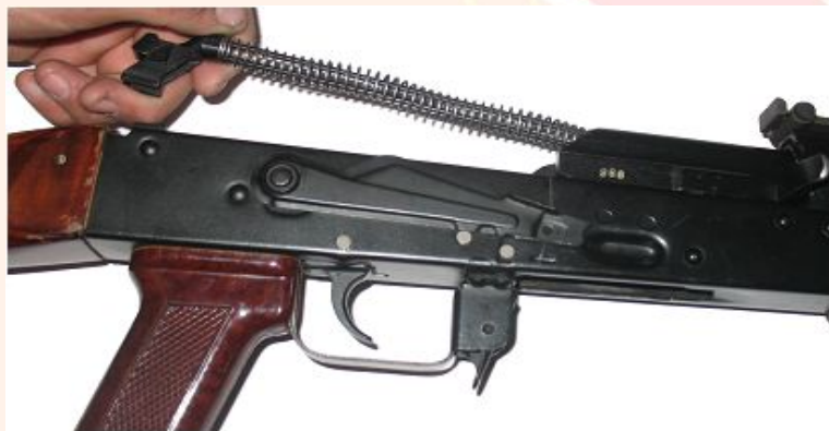
Рис.7 Отсоединить возвратный механизм