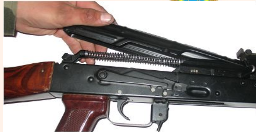
Рис. 6 Отсоединить крышку ствольной коробки