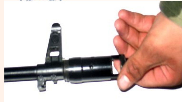
Рис.5 Отсоединить дульный тормоз компенсатор, у РПК-74 отсоединить пламегаситель.