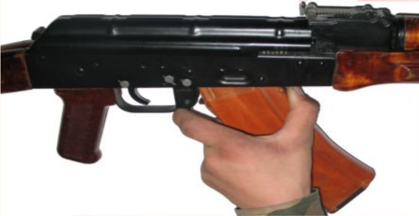
Рис. 1 Отделить магазин