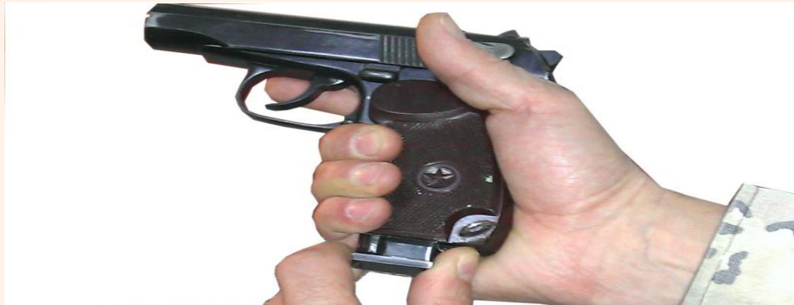
Рис. 1. Извлечь магазин из основания рукоятки Проверить, нет ли в патроннике патрона