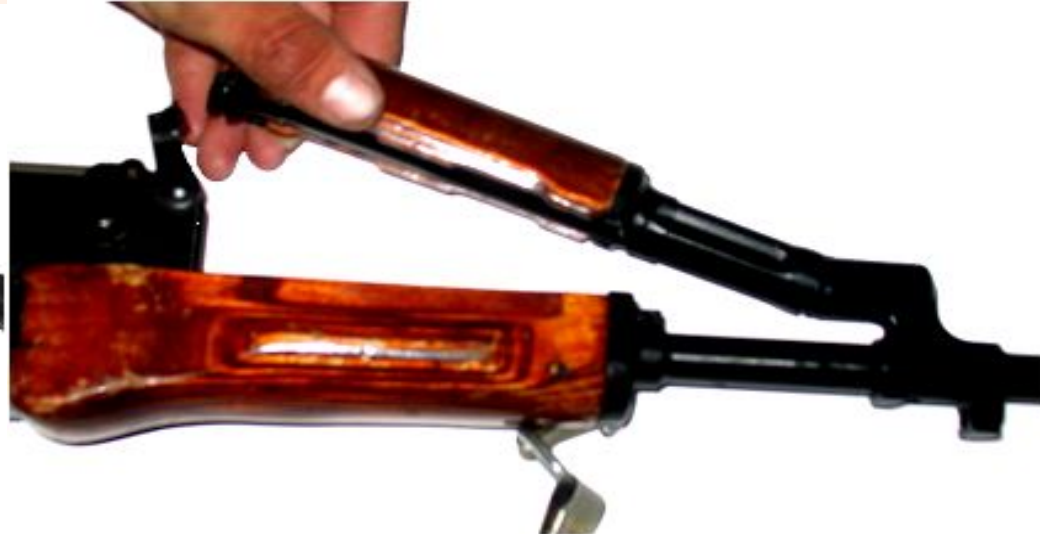
Рис. 10 Отделить газовую трубку со ствольной накладкой

Сборку автомата (пулемета) проводить в обратной последовательности