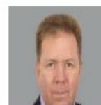
Гречушкин Николай Николаевич

Действительный государственный советник Российской Федерации 1 класса