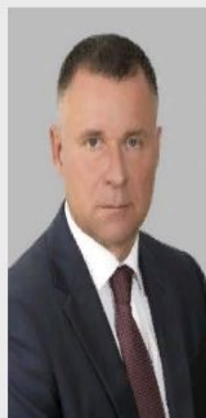
Зиничев Евгений Николаевич

Заместитель Министра Российской Федерации по делам гражданской обороны, чрезвычайным ситуациям и ликвидации последствий стихийных бедствий