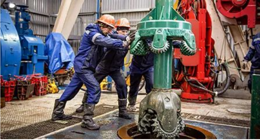
Пошук та розвідка нових ділянок вуглеводнів