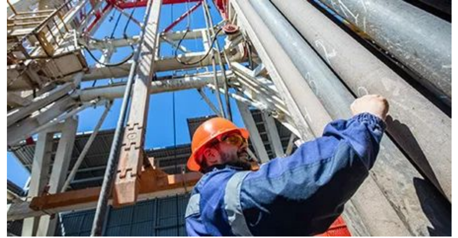
Видобування газу і рідких вуглеводнів