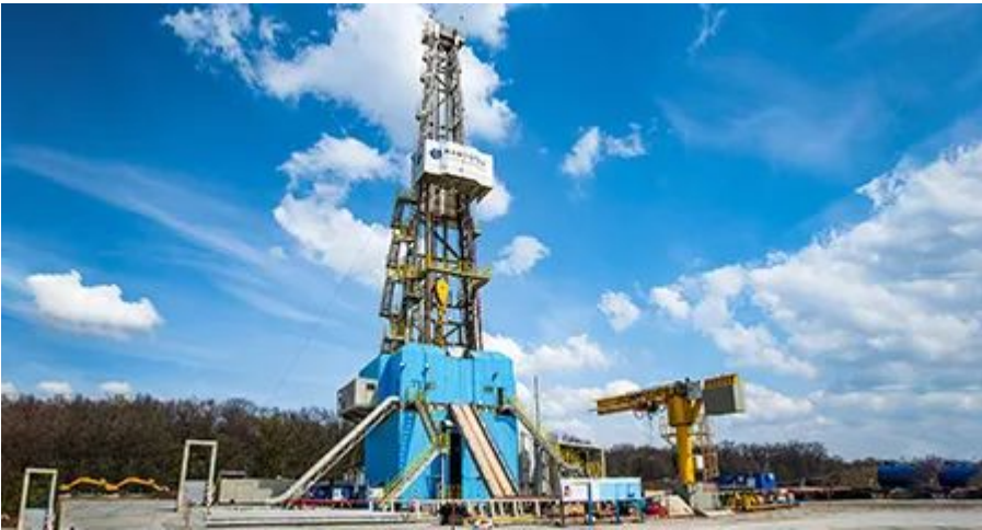
Розробка наявних нафтогазових родовищ