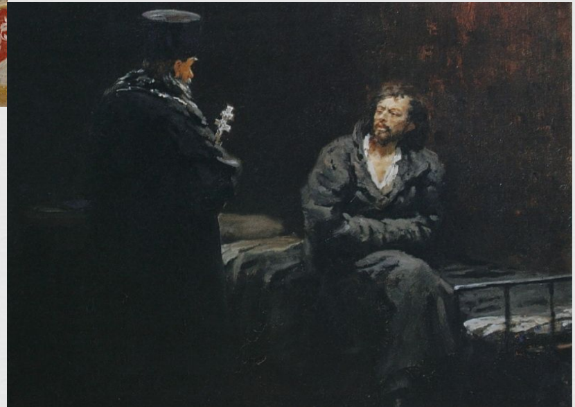
"Refusal from the Confession"