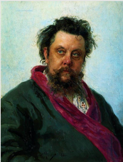
"Portrait of the Composer Modest Musorgsky"